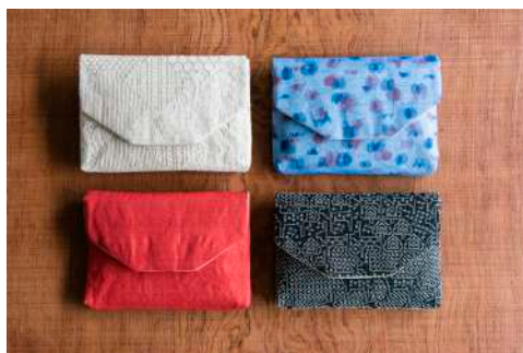
中川政七商店がデザインしてきたオリジナルの生地で作った「数寄屋袋」。お茶だけでなく、クラッチバッグのようにして普段使いにも。¥7,560～

良質な素材を使ってきめ細やかにデザインされた『茶論』の稽古道具や日常使いのアイテム。ふとした所作や佇まいに美しさを添えます。