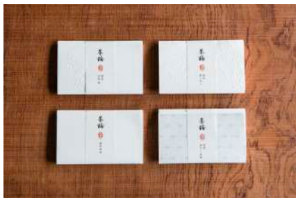
一般的な無地のものから透かし模様、浮彫などの柄もの、水菓子用や男性用まで揃う「懐紙」のラインアップ 全て ¥432