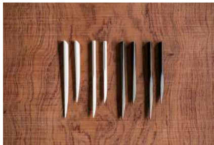
漆塗りや象牙、奈良の鹿の角を使った「菓子切」 ¥3,780～