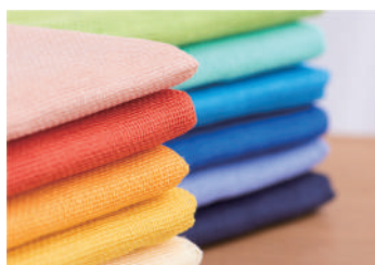
奈良の工芸・かや織ふきん

中川政七商店の代名詞ともいえる、かや織ふきんの魅力を紹介するコーナーでは、奈良土産にふさわしい品々を多数取り揃えます。