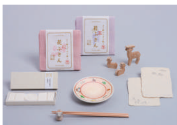
奈良土産（同店限定品）

中川政七商店の代名詞ともいえる、かや織ふきんの魅力を紹介するコーナーでは、奈良土産にふさわしい品々を多数取り揃えます。