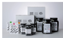
江の浦海苔本舗【福岡】