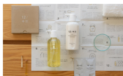
木村石鹸工業【大阪・三重】