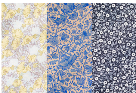
▲ 左からポピー・ロータス・デイジー

日本の絹織物からインスピレーションを受けてつくられたと言われるリバティプリント。今回、伝統ある3種の花模様が中川政七商店限定カラーとして新たに誕生しました。また非常に細く上質な綿糸を用いた生地は、シルクのような手触りと艶が特徴です。日々暮らしを華やかに彩ります。