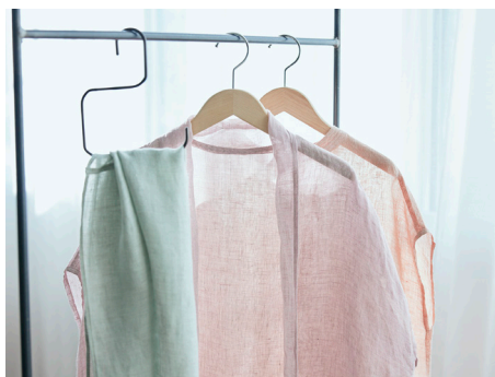
▲ 左からアジサイ・カーネーション・バラ

母の日の定番であるカーネーションに、華やかなバラ、落ち着いた色のあるアジサイを加えた3色の花染め。花の色素をタンパク質で固定する現代の染織技法“ボタニカル・ダイ”を用いて、従来の草木染めでは表現できない鮮やかな色味に仕上げました。自然由来の染料なので環境にも優しく、色落ちもしにくいので長くお使いいただけます。