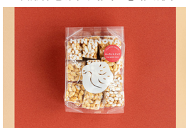
ボン菓子「ひなのや」(愛媛)