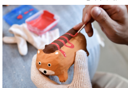
張子「Good Job!センター香芝」(奈良)