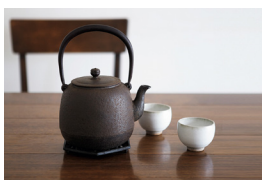
鉄瓶、急須「長文堂」(山形)