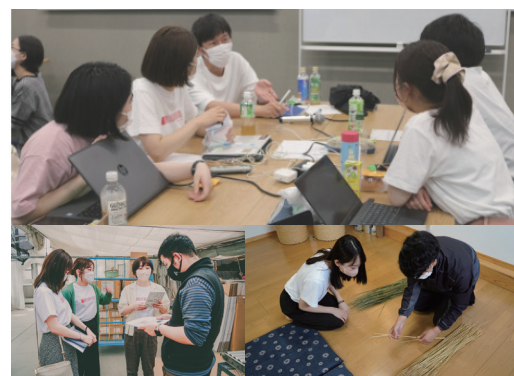
※2021年3月～7月の研修・準備期間 × 学生18名分の総時間

また学生は、アナザー・ジャパンにまつわる経営・企画展運営・店舗運営・プロモーション・接客販売のすべてを担います。18名はそれぞれ各分野のエキスパートとして学びと実践を積み重ね、総計2,640※時間を超える研修・準備期間を経て開業を迎えます。