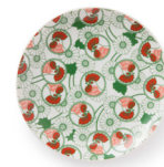
金鳥の夏日本の夏 九谷焼小皿/3,080円

金鳥の渦巻の缶入りミニサイズをハンカチに包みました。オリジナルの缶入りマツチも付属。