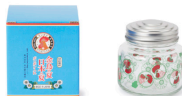
金鳥の夏日本の夏 ボンボン入れ/1,320円

昭和30~40年代の日本の食卓を彩ったプリントグラスと、蚊取り線香がモチーフのコースターセット。贈り物にもおすすめ。