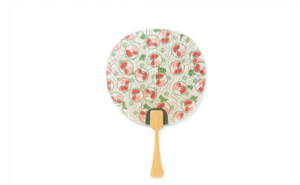
かや織うちわ 金鳥の夏日本の夏/1,430円

おなじみの鶏の絵柄を全面にデザインし、かや織の生地で作った目にも涼やかなうちわ。