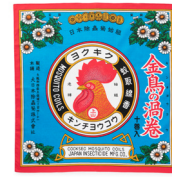
金鳥の夏日本の夏 風呂敷 金鳥の渦巻/3,300円

おなじみの鶏の絵柄を全面にデザインし、かや織の生地で作った目にも涼やかなうちわ。