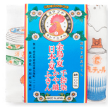
金鳥の夏日本の夏 手染めかや織ふきん 蚊取り道具づくし/550円

昨年大好評だったてぬぐいのモチーフ"蚊取り道具"がかや織ふきんに。素朴なイラストが愛らしい一枚です。