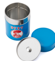
金鳥の夏日本の夏 ブリキ缶 ヨクキク/2,200円

かつて多くの家庭で見られたボンボン入れ。当時流行した花柄や僅かなズレのある2色刷りが懐かしさを感じさせます。