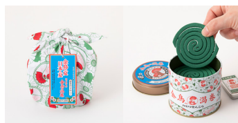
金鳥の夏日本の夏 初めての金鳥の渦巻/2,200円

蚊取り線香「金鳥の渦巻」をイメージ。短冊にはかや織と手織り麻を2枚重ねて、夏らしい涼し気な雰囲気。