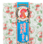
金鳥の夏日本の夏 ふきん/550円

金鳥の渦巻のパッケージをもとにしたかや織ふきん。マークの文字が「ヨクキク」から「ヨクフク」になっている遊び心も。