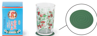
金鳥の夏日本の夏 レトログラストコースター/1,650円

奈良の工芸・かや織を用いたタオルに、金鳥の渦巻の鶏を描きました。洗いを重ねるほどに柔らかくなる質感も特徴。